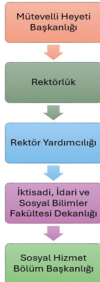
Şekil 1. KTO Karatay Üniversitesi Sosyal Hizmet Bölüm Başkanlığı'nın Organizasyon Şeması

Aşağıda Sosyal Hizmet Bölüm Başkanlığı'nın KTO Karatay Üniversitesi ile yönetsel ilişkisini gösteren organizasyon şeması görülmektedir.