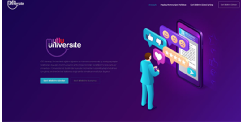
Görsel 6.1. Mutlu Üniversite Platformu

Memnuniyeti Değerlendirme Prosedüründe süreç detaylarıyla anlatılmış olup prosedür [60_OD5]'te sunulmuştur.