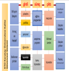
Şekil: KTO Karatay Üniversitesi Bologna Ölçüm Sistemi

Bologna Süreci çalışmaları bir ölçüm sistemi perspektifiyle yürütülmektedir. Bu ölçüm sisteminin temel parçaları aşağıdaki şekilde gösterilmektedir.