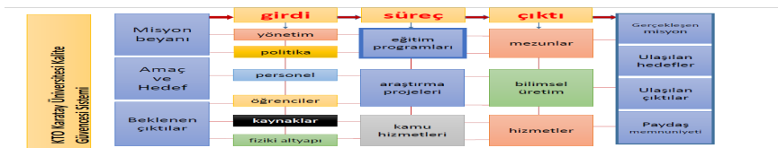
Şekil: KTO Karatay Üniversitesi Kalite Güvence Sistemi

Bu bağlamda kalite güvence süreci bütüncül bir anlayışla ve ulaşılan hedefleri paydaşlar ve mezunlar odaklı olarak değerlendirmeye alan bir kurguda tasarlanmaktadır.