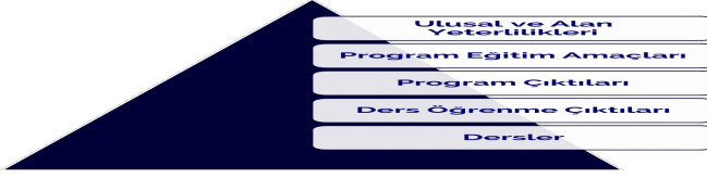
Şekil: KTO Karatay Üniversitesi Bologna Ölçüm Sistemi

Bologna Süreci çalışmaları bir ölçüm sistemi perspektifiyle yürütülmektedir. Bu ölçüm sisteminin temel parçaları aşağıdaki şekilde gösterilmektedir.