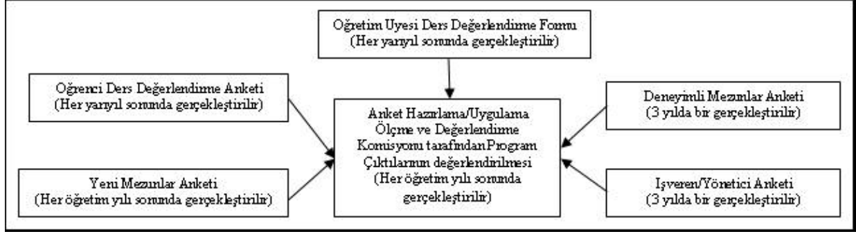
Şekil 1. Program Çıktılarının Ölçülmesi Süreci

Derslerin, program çıktılarına katkısı belirlenirken Öğrenme Çıktıları-Program Çıktıları İlişkisi matrisinden (ÖÇ-PÇ Matrisi, bkz. EK I-A Ders İçerikleri) yararlanılmıştır. Derslerin tümü için öğretim üyeleri/elemanları Fizyoterapi için ÖÇ-PÇ Matrisleri hazırlamışlardır. Böyle bir ilişkilendirme, bir dersin programa ne derecede katkısının bulunduğu görülmesine ve dersin programa katkısının artırılması için dersin genel hedeflerinin ve öğrenme çıktılarının gözden geçirilmesine yardımcı olmaktadır. Bu tabloda dersin her bir öğrenme çıktısının tüm program çıktılarına katkısı rakamsal ifadeyle yer almaktadır. Aşağıdaki tabloda örnek bir ders için ÖÇ-PÇ matrisi görülmektedir.